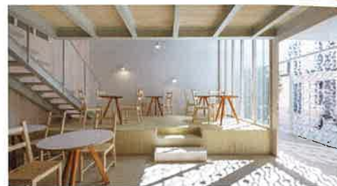
Santacreu Hotel af Diego López Fuster + SUBARQUITECTURA.

– Vi er meget stolte over projektet, og det har været en stor fornøjelse at opholde sig på øen og blive en del af dens puls. På den måde har projektet også været givende for os, da vi har kunnet udforske det lokale. Vi har arbejdet med et lille budget, men til gengæld har vi haft 100 % frihed inden for de krav, der er til et byggeri på en så unik beliggenhed. Der er mange restriktioner for at beskytte naturen og landskabet på øen, og derfor har vi måttet arbejde på en diskret måde med mange traditionelle materialer, som er gennemtestede gennem historien, såsom fliser, fortæller Fernando Valderama fra SUBARQUITECTURA og slutter af: