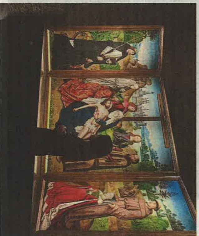
Tríptic de la Lamentació, del Mestre de la Llegenda de santa Llúcia

L'hospital de Sant Saver, que s'amaga darrere d'una de les poques façanes renaixentistes que hi ha a Barcelona, va mantenir la seva activitat assistencial fins al